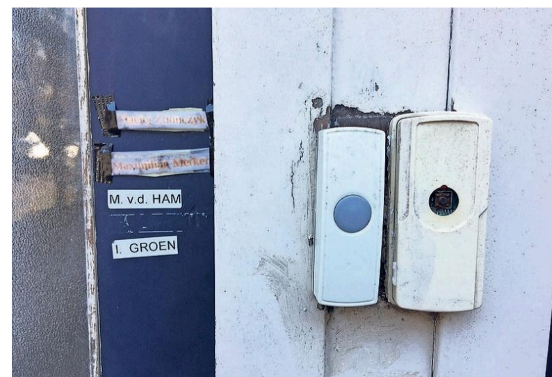
Veel voorkomend verschijnsel: meerdere deurbellen.